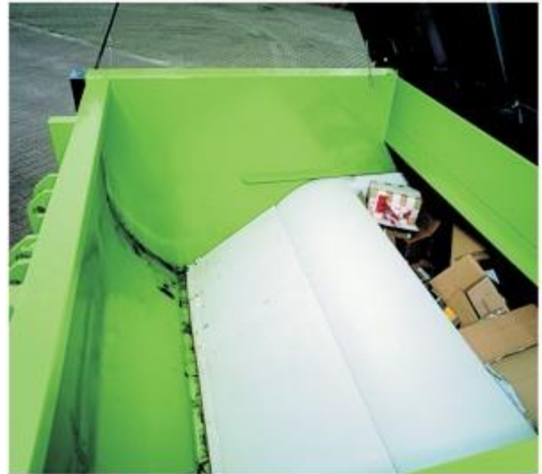
4. În poziția înainte de presare (comprimare).