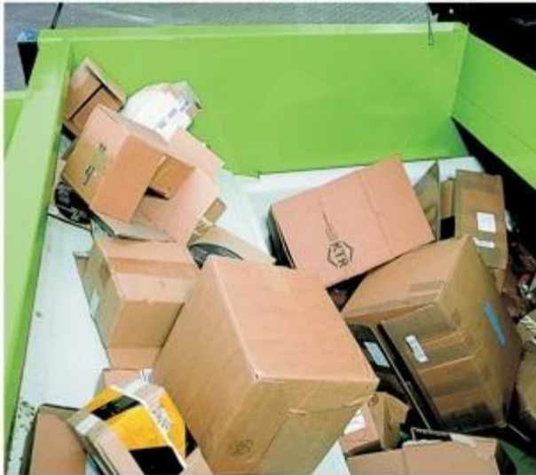
3. În poziția înapoi de alimentare cu material