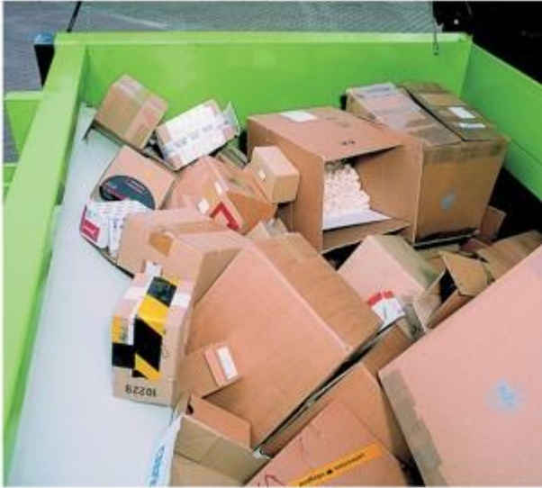
1. Prezentarea cilindrului în poziția de alimentare înapoi.