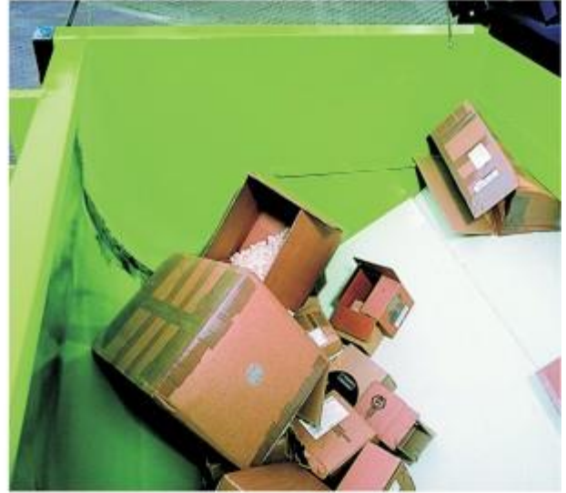
2. Prezentarea cilindrului în poziția de presare înainte.